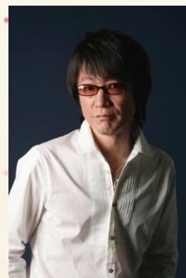
小杉 十郎太 さん