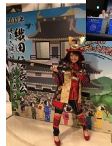
↑信長学フォーラム in 東京の様子