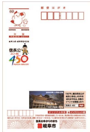
「オリジナル年賀はがき」イメージ

※11月7日(月)以降は、岐阜市役所(本庁舎低層部 地下1階)で開庁日時に販売(11月4日の販売残数を販売しますので、完売となった場合は岐阜市役所での販売は行いません)。