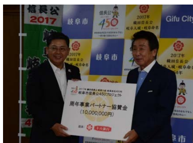
写真は株式会社十六銀行との協賛金受領式の様子